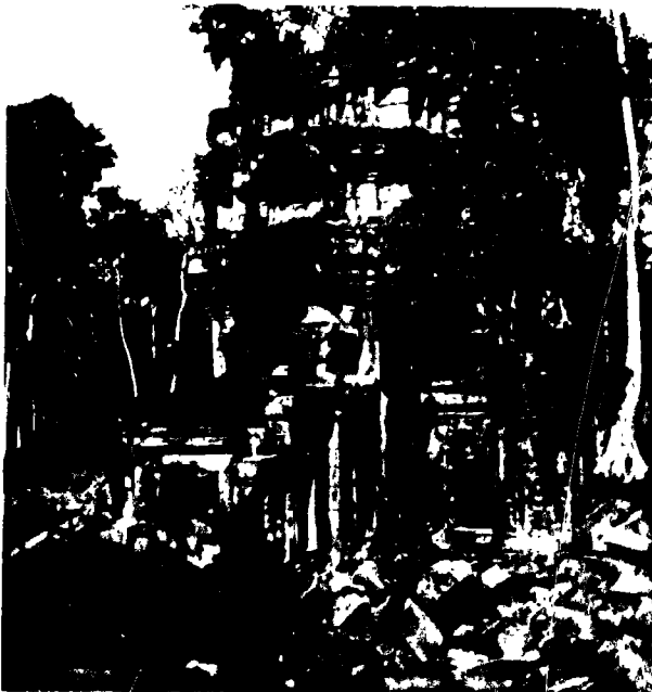
Fig. 4. - Prah Khan de Kompong Svay. Type d'édifice en état relativement bien conservé.