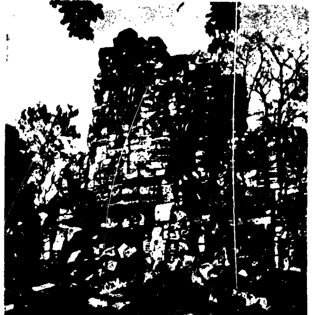
Fig. 5. - Prah Thkol. Edifice intéressant qu'il serait utile de restaurer.