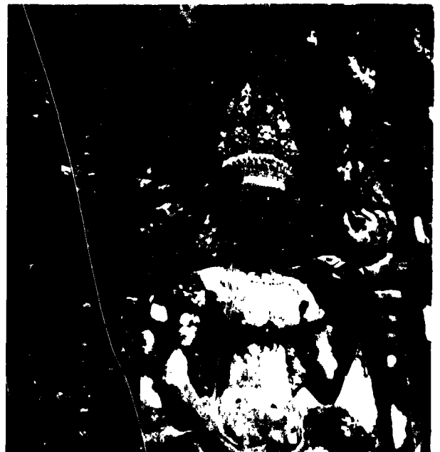
Fig. 6. - Prah Khan de Kompong Svay. Type de devanté du style d'Angkor Vat. Première moitié du XIIe siècle.