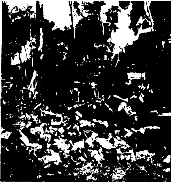
Fig. 3. - Prah Khan de Kompong Svay. Etat des ruines vers le centre de la première enceinte.